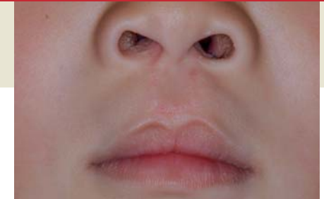
Lippenpalte nach Operation

Hierzu berücksichtigen wir aktuelle Therapieleitlinien und ethische Gesichtspunkte und wenden modernste Operationsverfahren an.