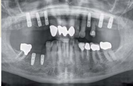
Dentale Implantate in Oberkiefer und Unterkiefer