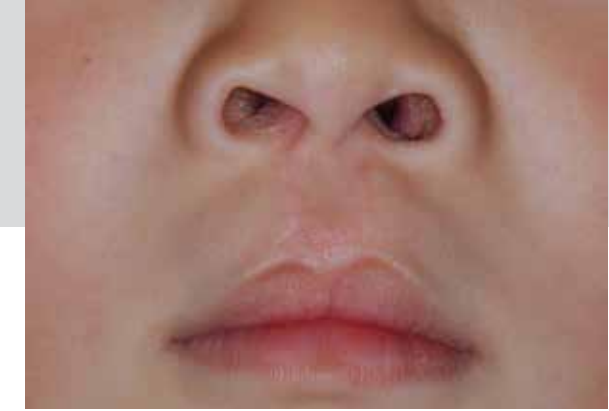
Lippenspalte nach Operation