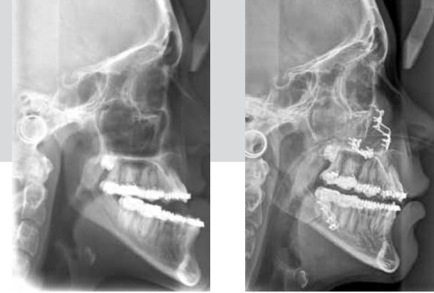
Kieferfehlstellung vor und nach der Korrektur