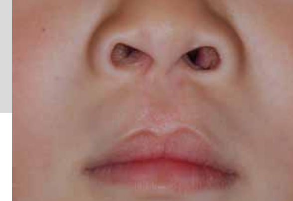
Lippenspalte nach Operation