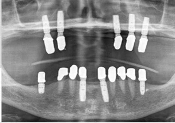
Dentale Implantate für herausnehmbaren Zahnersatz